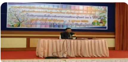
กลุ่มนโยบายและแผน