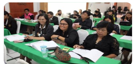
สพ.สุรินทร์ เขต 3